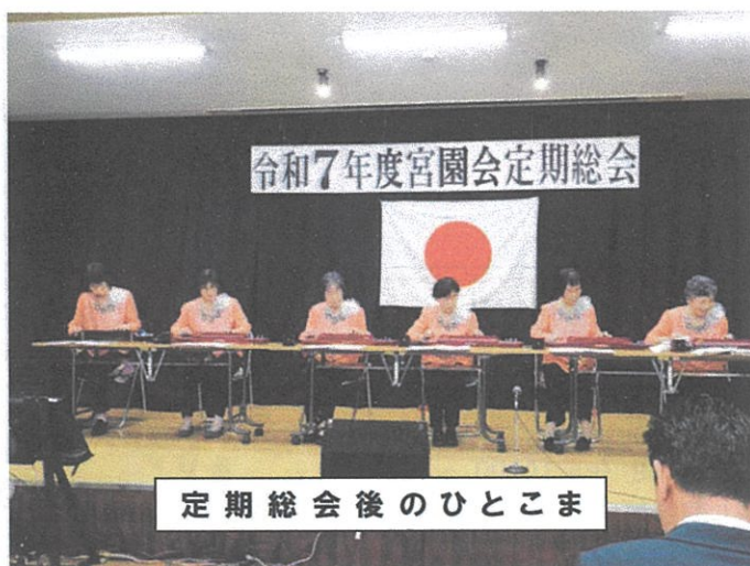
定期総会後のひとこま