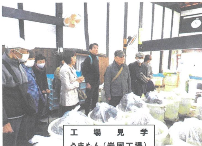
工場見学 うまもん(岩国工場)