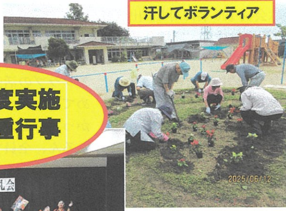
汗してボランティア