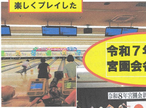
楽しくプレイした

発行所 宮園 9-9-5 中高校クラブ 宮園会 発行責任者 高橋 正 TEL (0829) 38-3055