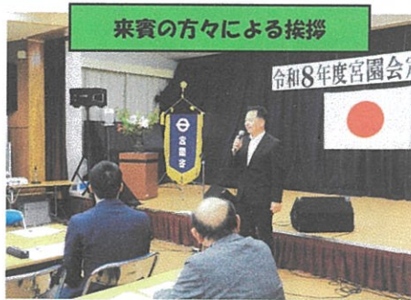
来賓の方々による挨拶