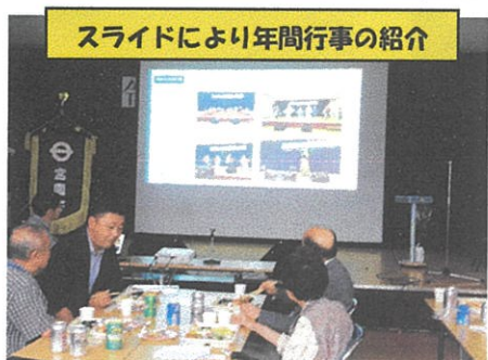
スライドにより年間行事の紹介