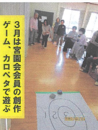
3月は宮園会会員の創作ゲーム、カロペタで遊ぶ

すみれ倶楽部は、毎月最終火曜日午後、8丁目集会所を会場に13時30分から15時の間で開催しています▲この会の進行は、①会歌合唱、②ラジオ体操、③テーマ、④おやつとおしゃべりタイムです。出席者は大体16名から20名で大変賑やかです▲③テーマは、月ごとに内容が変わります。3月のテーマは、宮園会創作のゲーム「カロペタ」にて遊び、4月は、色紙で「ミニ兜」作りでした▲5月のテーマは、「〇人で来ました」ゲームでした。参加者全員が輪になり、「一人で来ました」と一人が手を上げ、隣の二人が「二人で来ました」、次の三人が「手を上げ...」を繰り返して人の輪を一周するのですが、声と手を上げるのを同時に行うという単純なゲームなのに、なかなかどうして...失敗するたびにどっと笑いが出て、爆笑の連続でした▲世話人一同、楽しんでいただけるように毎回テーマに知恵を絞り、皆様のお越しをお待ちしています。(記事 村岡)