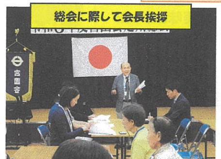
総会に際して会長挨拶