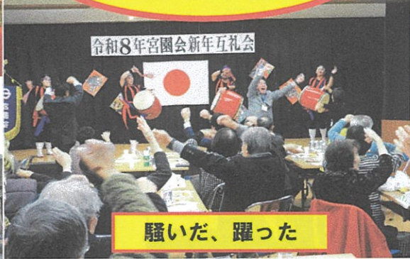
令和8年宮園会新年互礼会