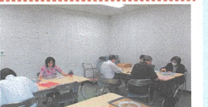
令和8年6月23日実施分

宮園会の会歌「いまを楽しく宮園会」と共感を覚えます。新しい酒は古い革袋で味を深める。令和八年度が「AI」と「結晶」が響き、「絆」の輪が輝く年でありますように祈念します。