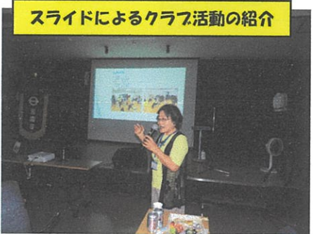
スライドによるクラブ活動の紹介