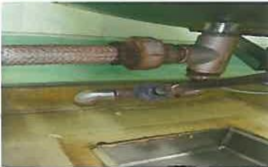
① ドレンバルブより蒸気漏れ