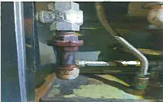
① 蒸気漏れ(給気バルブ)