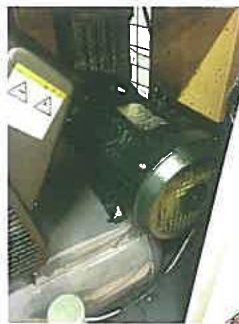
コンプレッサー圧力確認