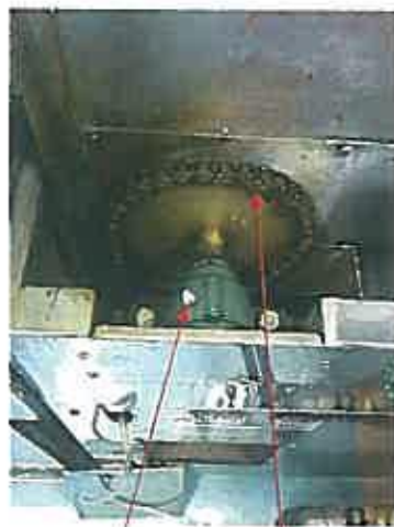
グリス注入、オイル注油