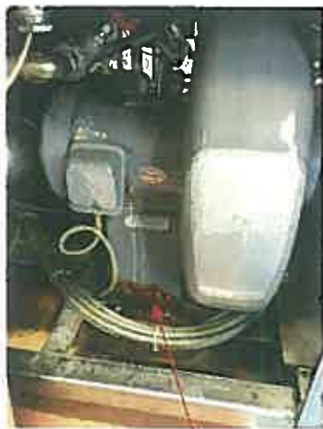
ブローモーター、腐食有り