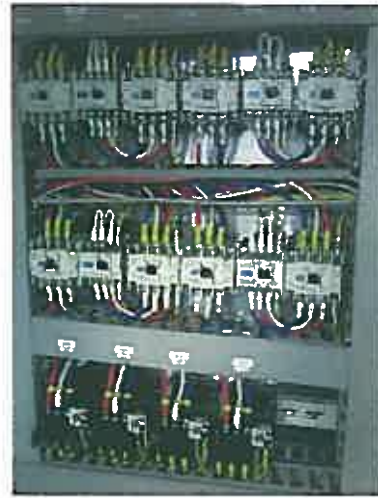
絶縁、電流値測定 NO.2 111A NO.3 112A