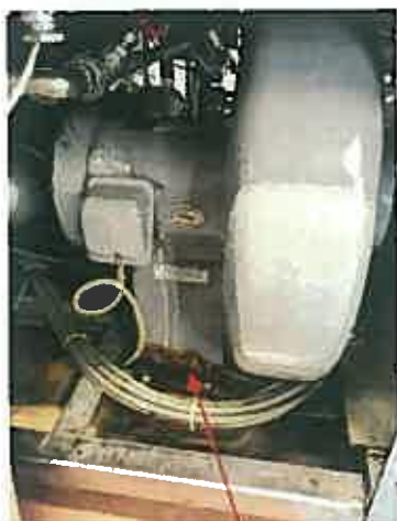
ブローモーター、腐食有り