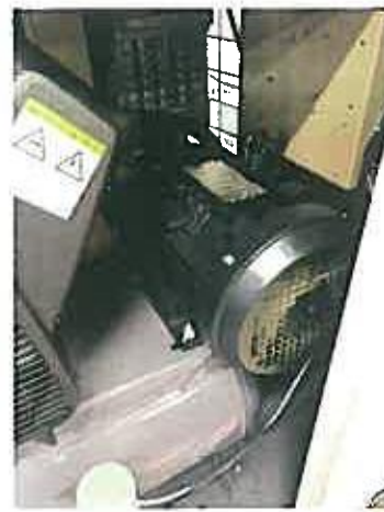
コンプレッサー圧力確認