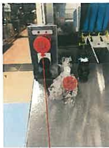
非常停止スイッチ交換