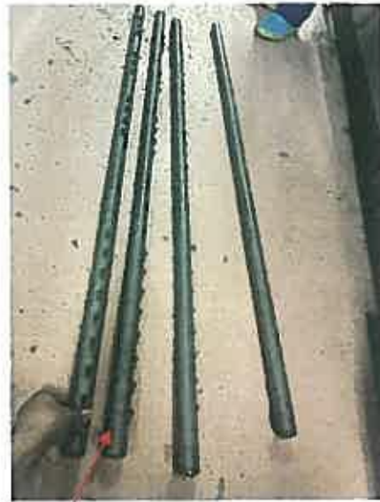
洗浄ノズルパイプ清掃