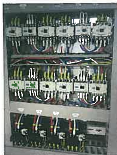
絶縁、電流値測定 NO.2 111A NO.3 120A