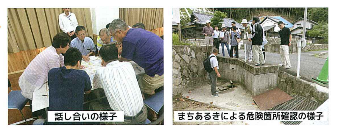
話し合いの様子 まちあるきによる危険箇所確認の様子

このハザードマップは、大雨による土砂災害を想定し地区のみなさんと話し合いを重ねながら作成したものです。ハザードマップには、 災害危険箇所 、 指定緊急避難場所 、 避難時の注意箇所 などをまとめています。ご家庭などで指定緊急避難場所や避難ルートなどを確認し、早めの避難ができるよう備えておきましょう。