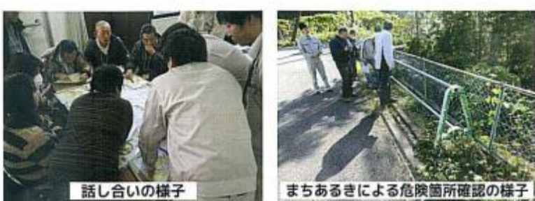
話し合いの様子 まちあるきによる危険箇所確認の様子

このハザードマップは、大雨による土砂災害を想定し地区のみなさんと話し合いを重ねながら作成したものです。ハザードマップには、災害危険箇所、指定緊急避難場所、避難時の注意箇所などをまとめています。ご家庭などで指定緊急避難場所や避難ルートなどを確認し、早めの避難ができるよう備えておきましょう。