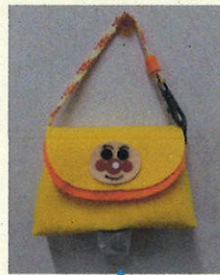
下からビニール袋を取り出せます

始めに、さいき図書館の方に楽しい絵本の読み聞かせをしていただきます。どんなお話はお楽しみに!その後、順番にビニール袋入れを作ります。便利な携帯できるアンパンマンのビニール袋入れ。ママ達にはアンパンマンの顔のパーツを貼ってもらうだけで完成です。(中にはビニール袋も入ってお得です)