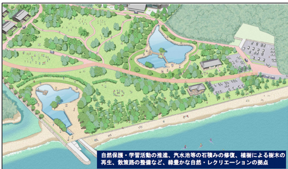
【 図-4 エリア3事業イメージ 】