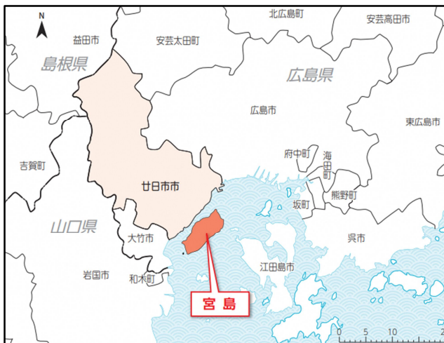
【 図-1 位置図 】

廿日市市宮島包ヶ浦自然公園 広島県廿日市市宮島町1195 1153-8 1153-5