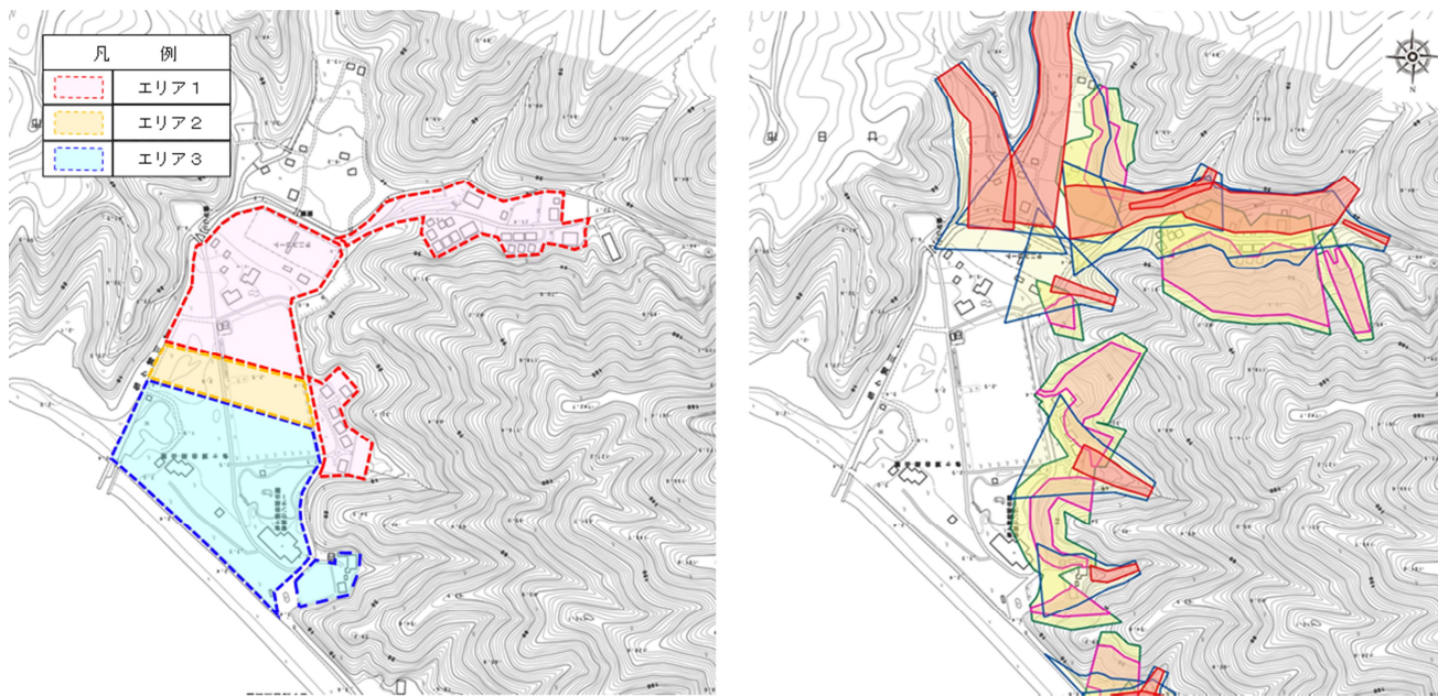
【 図-3 エリア区域 ・ 土砂災害警戒区域等の分布 】

エリア1の一部には、土砂災害特別警戒区域、土砂災害警戒区域が含まれる。この区域を事業に活用する場合は法令等の規制に基づいて実施すること。