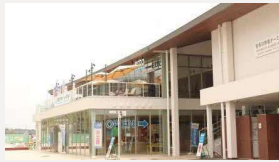
宮島口旅客ターミナル