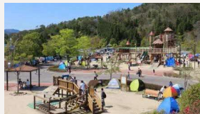
佐伯総合スポーツ公園道の駅が羅漢