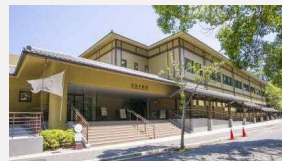
宮島水族館 (みやじまリン)