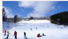
めがひらスキー場