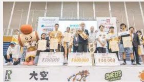
けん玉ワールドカップ