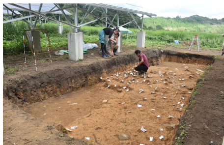
冠遺跡発掘調査の様子