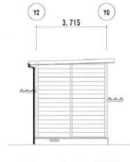
X0 立面図 S=1/100