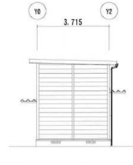
X8 立面図 S=1/100