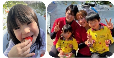
笑顔でパクリ! 選手とパチリ!

本市のいちご栽培は、約80年の長い歴史があります。最盛期は100件を超えるいちご農家がありましたが、オイルショックの影響で激減しました。そのような歴史を経て、近年では新たにいちご栽培を始める農家や「津田いちご」などブランド化に取り組む農家も増えつつあります。まだまだ、いちごのシーズンです。おいしい地元のいちごを楽しみましょう。