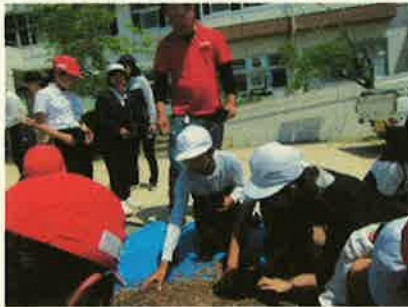
＜種をポットに植えています＞