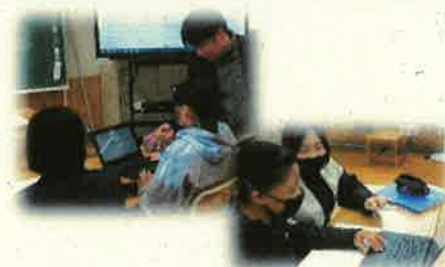
＜吉和ラフリーズインタビューの様子＞