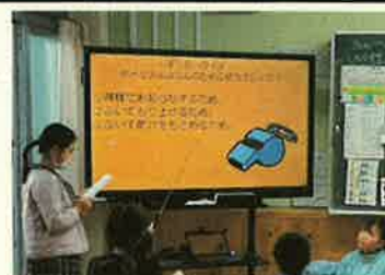
<他学年への防災発表>