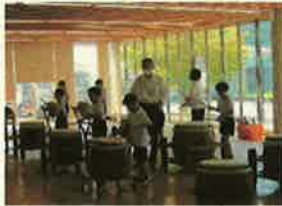
<烏神太鼓 演奏体験>