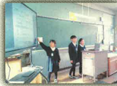
＜プレゼンテーション＞