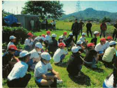
＜商工会や地域の皆さんとの活動＞