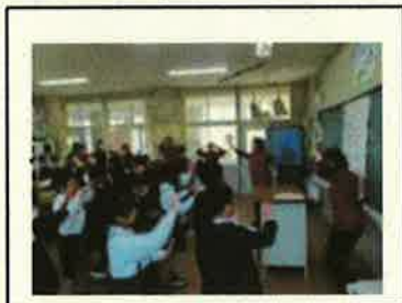
< 手話体験 >