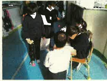
＜校内の大会の様子＞