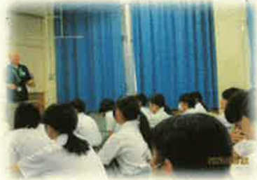
＜市役所の方の講話＞