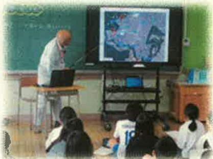
<地域の防災の講話>