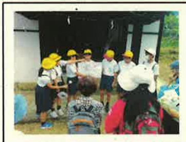
< 史跡巡りツアー当日 >

・郷土文化保存会の方から地御前の史跡について学び、さらに関心をもったことを調べまとめました。