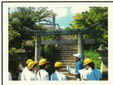
< 事前学習 >

・郷土文化保存会の方から地御前の史跡について学び、さらに関心をもったことを調べまとめました。