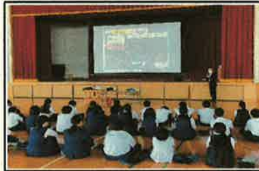
<マイタイムライン講習>