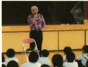
＜地域の方にインタビュー＞