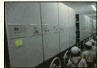
＜大野図書館内の書庫＞