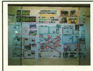
< 事後発信 >

・“地御前史跡巡りツアー”のガイド役を務め、紙芝居やペープサートを駆使して説明しました。