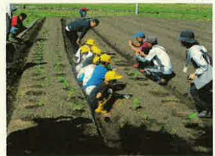
＜ポットで育った苗を植えています＞