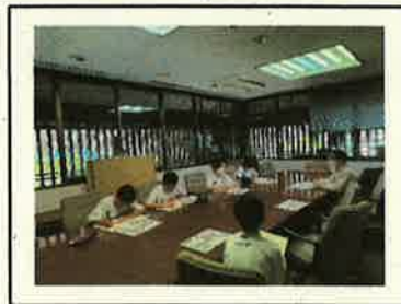
<宮島訪問インタビュー>