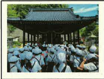
<地域人材・財産の活用>