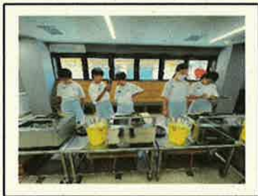
<宮島産業体験学習>