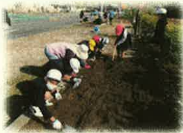
<親水公園の花壇作り>