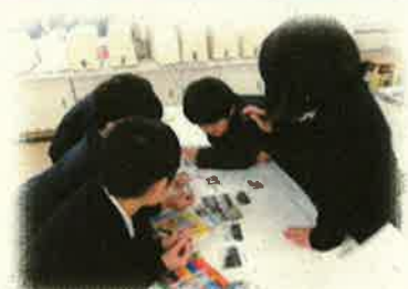
<地域のおすすめマップ作り>

地域の「見守り隊」に協力してもらい、活動した。花壇作りでは、花壇の土作りや苗植えと一緒にいった。佐伯音頭は、お手本を見せてもらいながら学習した。マップ作りでは、地域探検に引率の支援に入ってもらった。地域の方と共に学習できることで児童が主体的に活動できるだけでなく、地域の方とのつながりを深く感じる事ができた。また、佐伯音頭は、学習発表会だけでなく、150周年の式典でも披露し、今後友和小学校の3年生が引き継ぐ土台ができた。