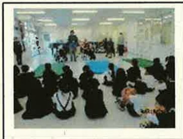
< 点字体験 >