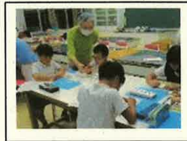
< 車椅子体験 >