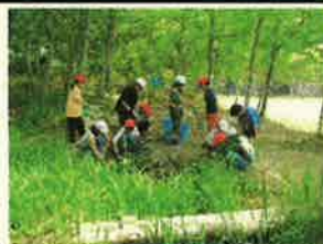
＜ 生き物観察 ＞