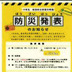
<防災発表の呼びかけ>