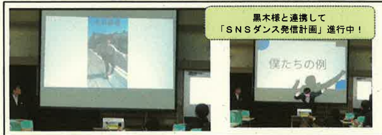
<学習発表会でのプレゼンテーションの様子>