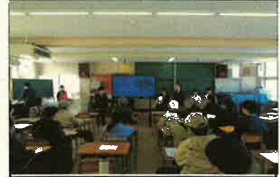
<阿品台防災自主訓練>