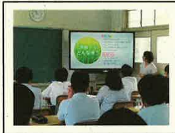
<ゲストティーチャーの講義>