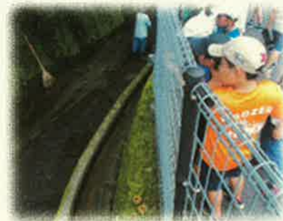
<砂防堰堤・水路見学>