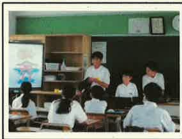
<宮島学習クラス発表会>