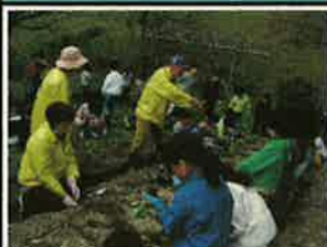
＜キャベツの苗植え＞