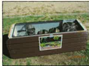
＜大野東市民センターのかまどベンチ＞