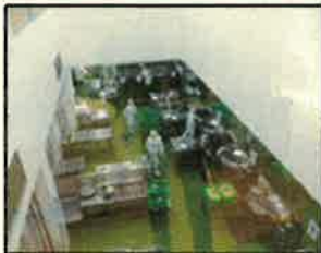
＜大野給食センター＞