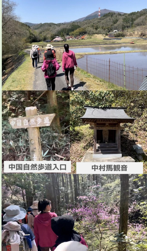
中国自然歩道入口