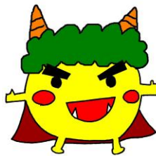
スマイルン (豆まき)