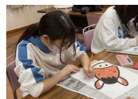
紙に絵を描きます