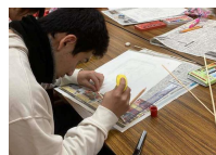
竹ひご、凧の足を付け 凧糸を張ります