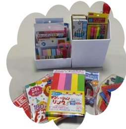
集まった文房具類の一部