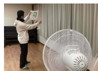
凧が揚がるか扇風機 の風で試します