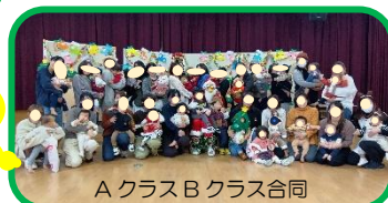
AクラスBクラス合同

一ようこそ♡あかちゃんー 12/16(火) 大泣きしながらサンタさん に抱っこしてもらって写 真を撮りました！