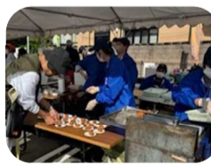
カキフライの試食

これもひとえに実行委員の皆さん、 地域のみなさんのおかげです。前日か らの準備、当日の運営から後片付けま で、ご協力をいただきありがとうござ いました。