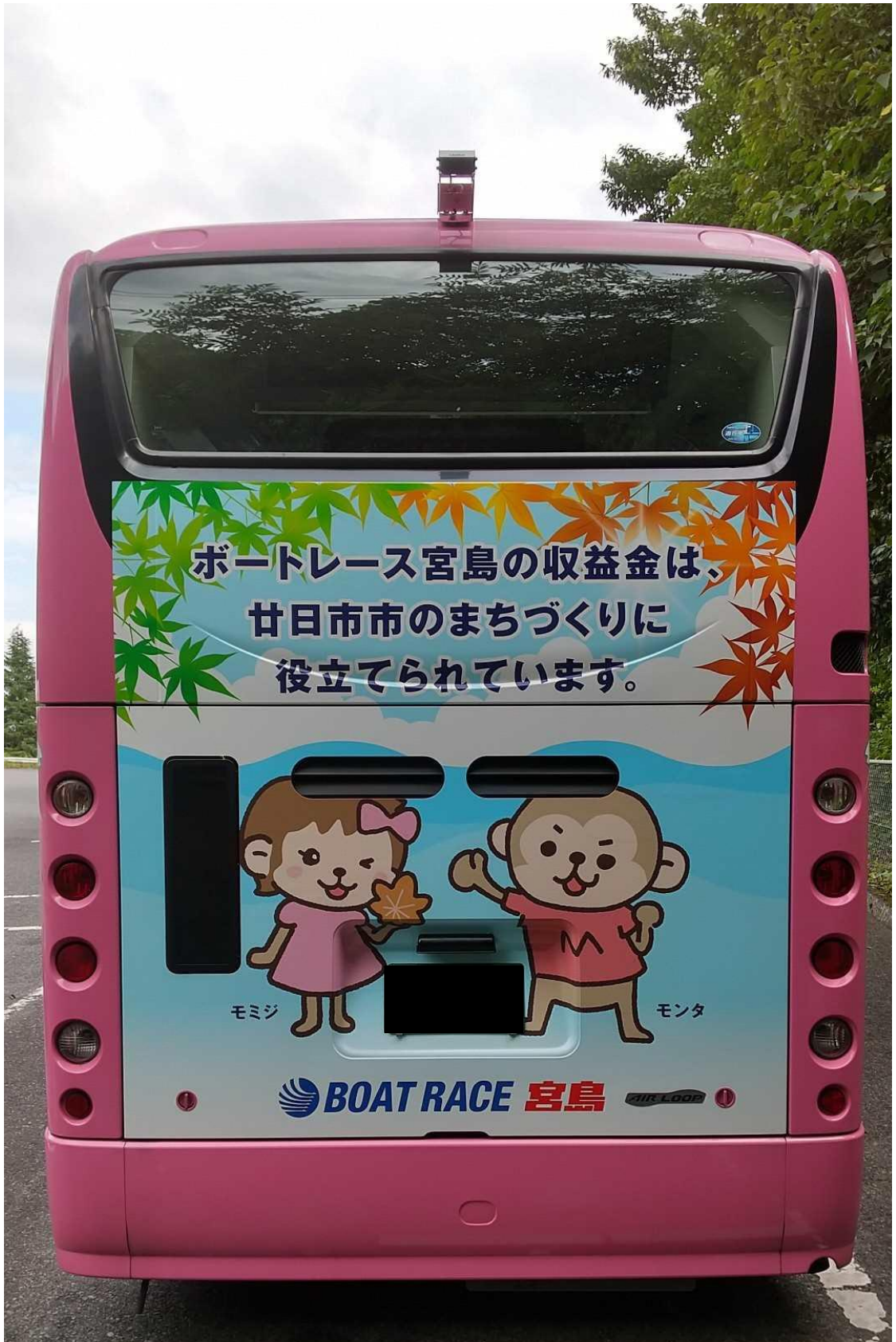
【廿日市さくらバス（宮内ルート）】後部 部分ラッピング