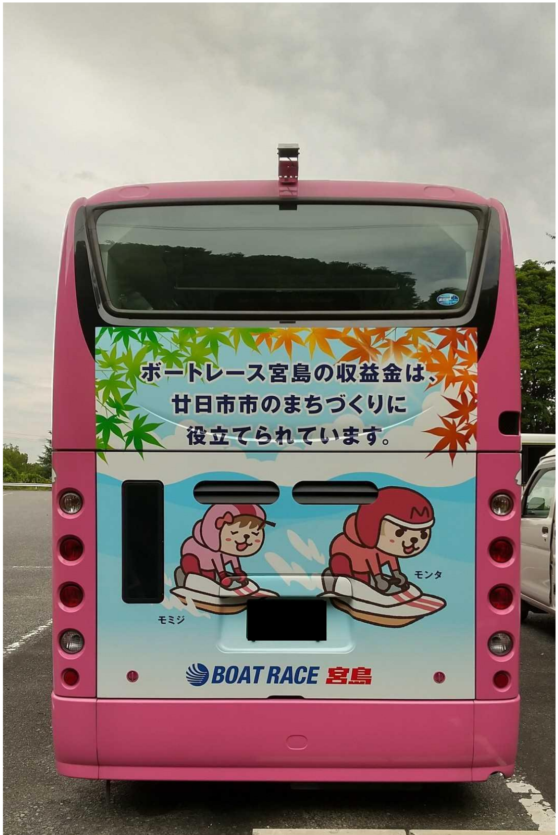
【廿日市さくらバス（西循環）】後部 部分ラッピング