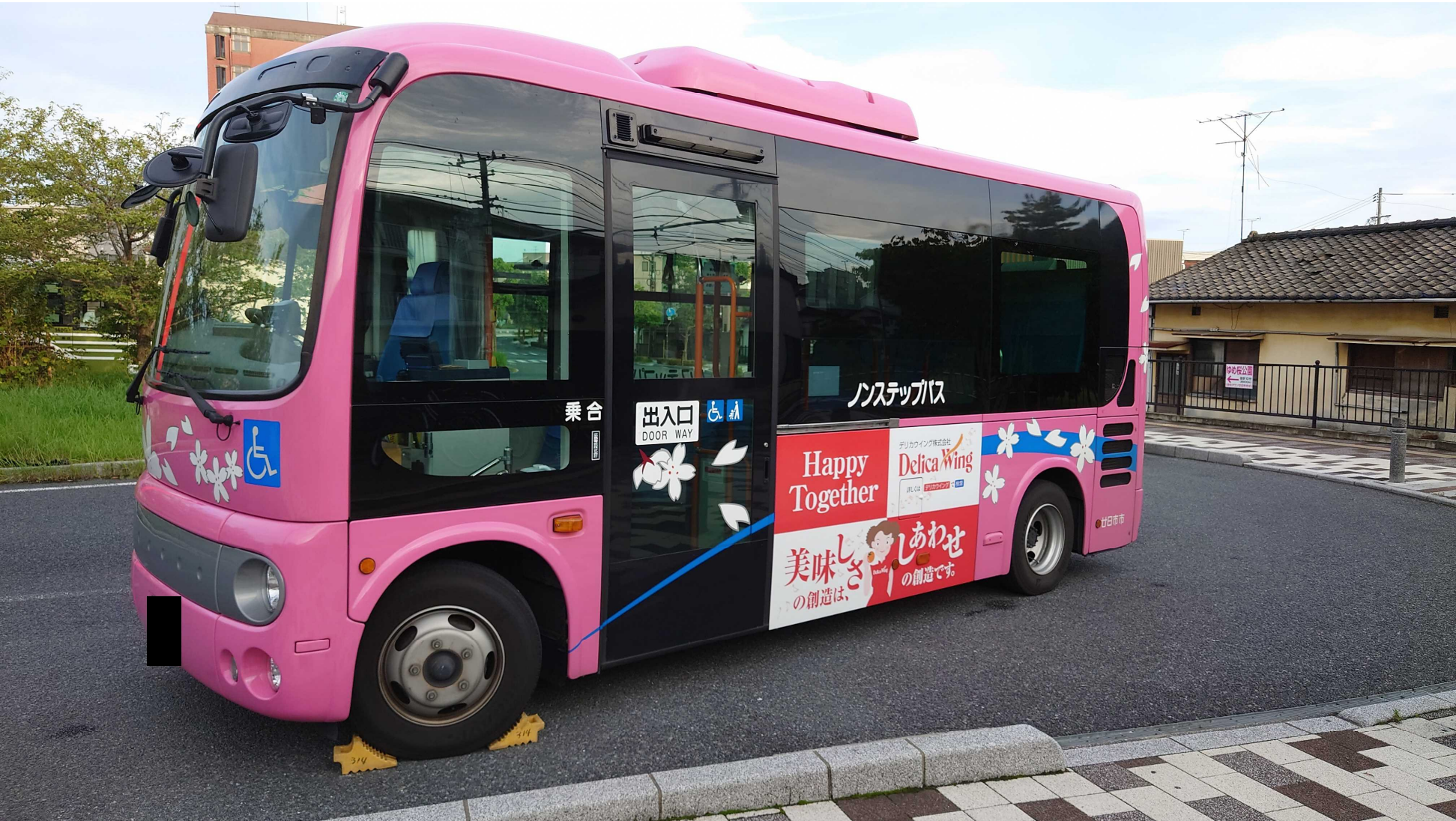
【廿日市さくらバス（西循環）】ドア側側面 部分ラッピング