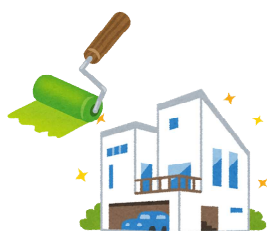
リフォーム資金に