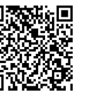
▲集団接種予約サイト(24時間対応)