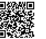
▲コロナワクチンナビ