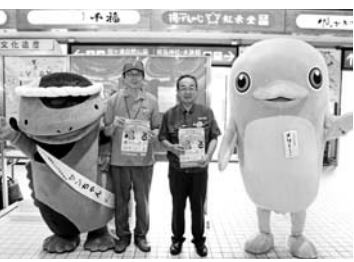
7月13日に宮島橋で両施設のキャラクターである、スナメリのメリーちゃんとおオオサンショウウオのサンちゃんが職員と共にPR活動をしました。

水族館と動物園でスタンプを集めて、オリジナルの缶バッジをもらおう! とき 11月30日(月)まで ところ 安佐動物公園、宮島水族館