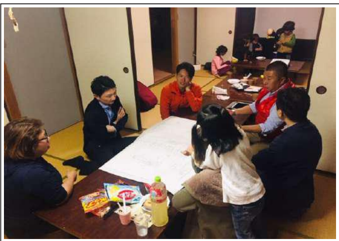
(福寿荘での座談会)

「吉和の未来づくり」の取り組みの一つとしての「あそび場作り」を話し合う「あそびば座談会」を6月から開催しています。毎月2回程度、福寿荘で18時30分～21時に開催しています。 「吉和に子ども遊び場がほしい！」の声から始まった座談会です。どなたでも参加は自由です。広く皆さんのご参加をお待ちしています。 次回は、12月17日（火）に吉和福祉センターで開催する予定です。