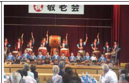
吉和学園やまびこ太鼓