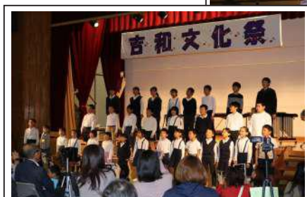
吉和学園児童・生徒