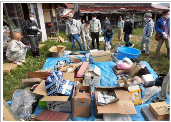
(実際の空き家での片付け実践 10/27)

第3回は、吉和地域内の空き家で「片付け実践・体験会」を開催しました。 第4回は、「まとめ座談会」を開催しました。 4回のシリーズを通して参加者は、空き家の現状やリスクや「家財の片付け方」を学び、地域内の空き家を使った具体的な片付け方の実践体験で「空き家」に対する理解を大いに深めることが出来たようです。