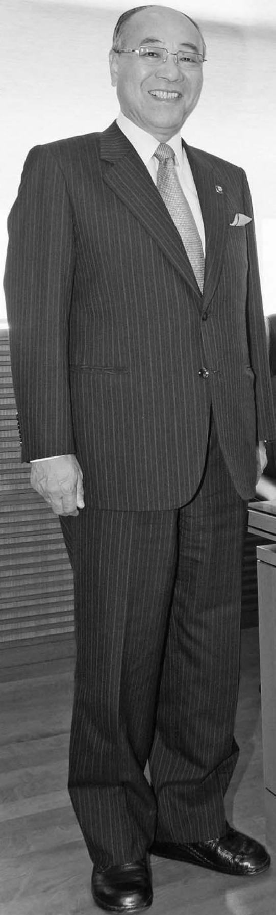
廿日市市長 眞野 勝弘