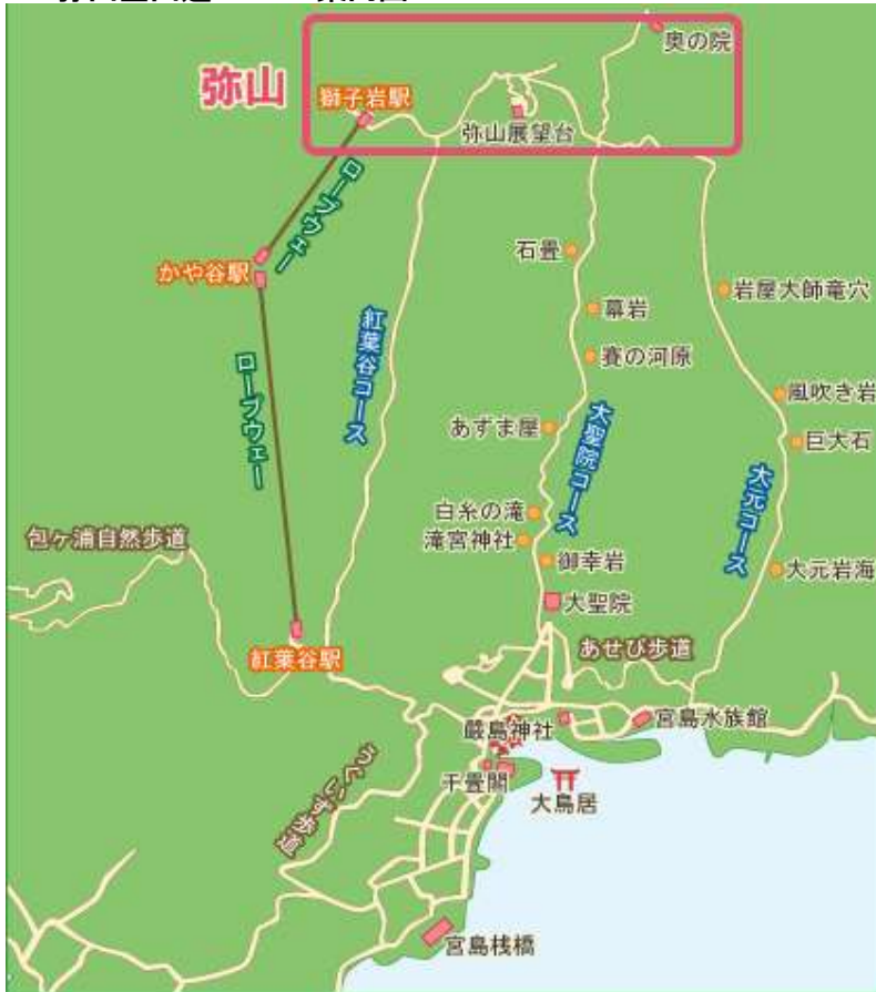
弥山登山道3コース案内図