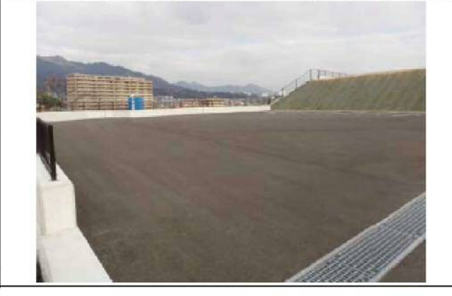
開発行為に伴う地形改変（民間施工）