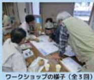
ワークショップの様子 (全3回) 現地確認の様子

このマップは、浅原地区のみさんとワークショップを重ねながら作成したものです。マップには、地区の災害履歴や危険箇所、避難場所、避難時の注意箇所などをまとめています。ご家庭などで最寄りの避難場所・避難経路などを確認し、早めの避難ができるよう備えておきましょう。