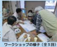
ワークショップの様子 (全3回) 現地確認の様子

このマップは、浅原地区のみさんとワークショップを重ねながら作成したものです。マップには、地区の災害履歴や危険箇所、避難場所、避難時の注意箇所などをまとめています。ご家庭などで最寄りの避難場所・避難経路などを確認し、早めの避難ができるよう備えておきましょう。