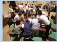
ワークショップの様子(全3回)

このマップは、津田・四和地区のみならずワークショップを重ねながら作成したものです。マップには、地区の災害履歴や危険箇所、避難場所、避難時の注意箇所などをまとめています。 ご家庭などで最寄りの避難場所・避難経路などを確認し、早めの避難ができるよう備えておきましょう。