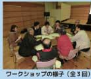
ワークショップの様子(全3回)

このマップは、玖島地区のみなさんとワークショップを重ねながら作成したものです。マップには、地区の災害履歴や危険箇所、避難場所、避難時の注意箇所などをまとめています。ご家庭などで最寄りの避難場所・避難経路などを確認し、早めの避難ができるよう備えておきましょう。