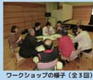
ワークショップの様子(全3回) 現地確認の様子

このマップは、玖島地区のみなさんとワークショップを重ねながら作成したものです。マップには、地区の災害履歴や危険箇所、避難場所、避難時の注意箇所などをまとめています。ご家庭などで最寄りの避難場所・避難経路などを確認し、早めの避難ができるよう備えておきましょう。