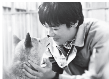
©2013ひまわりと子犬の7日間 チケット 6月30日販売開始

廿日の市 とき 7月20日(金)8時~11時30分 ところ 廿日市市役所市民プラザ