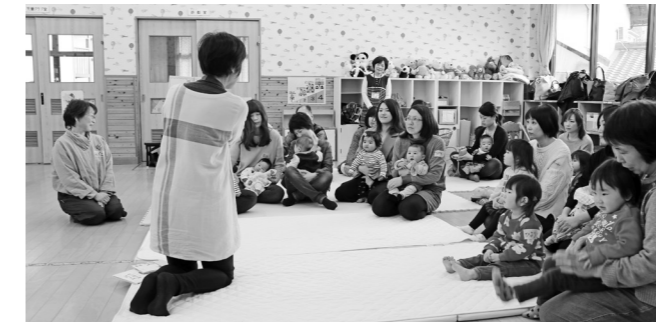
育児教室の様子(津田児童館)

●ウェブサイトの利用方法 パソコン、スマートフォンなどから「廿日市市はつくい」で検索するか、次のアドレスから閲覧してください。 https://hatsukaichi-city.mamafre.jp/