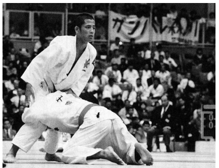
ひろしま国体柔道競技（サンチェリー）