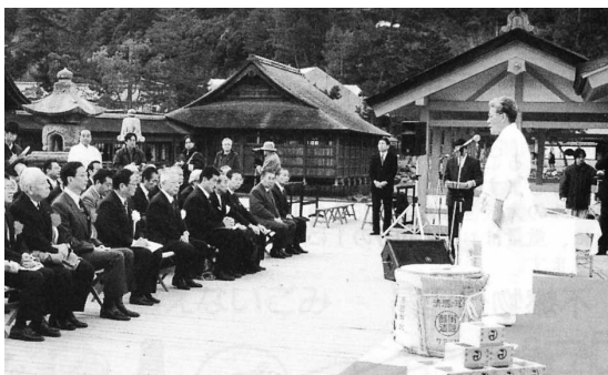
厳島神社世界文化遺産登録記念式典