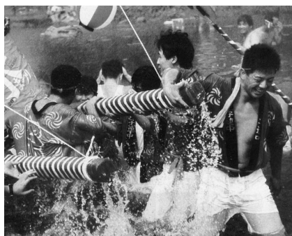
第1回さいき水まつり「水みこし」