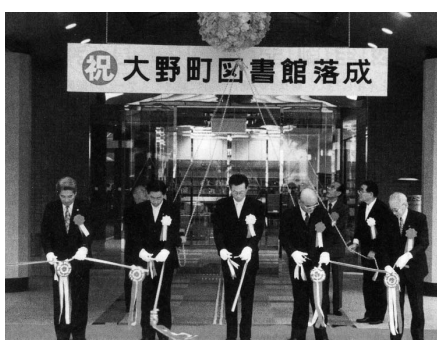
大野町図書館（当時）落成式