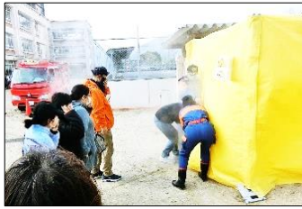
スモーク体験をするため、テントに入るところ。