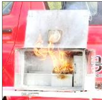
天ぷら油の火災実験用のミニチュアのキッチンで、加熱した油に水を注ぐと、火柱が上がりました。