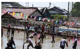
原地区 どんごパレード