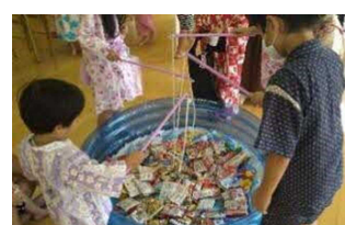
宮園地区 子ども夏祭り