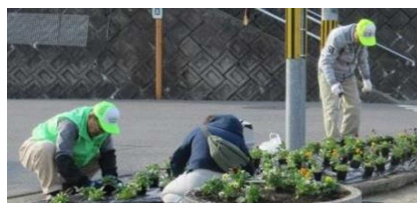
Distrito ng Sakata Pagtanim ng Bulaklak