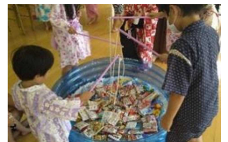
Distrito ng Miyazono Pagdiriwang ng mga bata sa tag-init