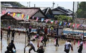
Distrito ng Hara Lambak ng Doronko

Sa tulong ng bawat isa, mapapanagtili at mgiging maganda ang lungsod.