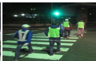
Distrito ng Kushido Pagpapatrol sa gabi