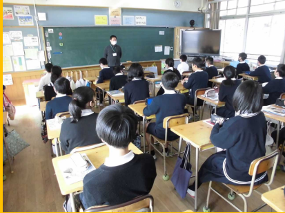
ベルが鳴る前に！「着ベル」の取組