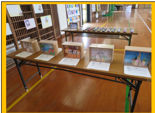
小中作品交流会の展示の様子