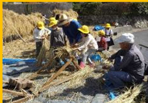
地域素材を生かした 地域の方との学習