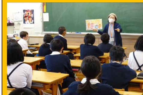
『読み聞かせの様子』