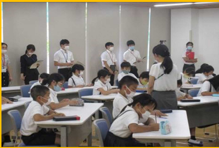
『小中合同研究授業』