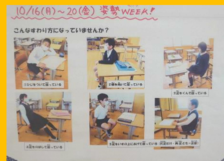
『姿勢ウィーク 姿勢の掲示物』