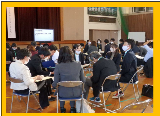
小中合同研究会 全体会