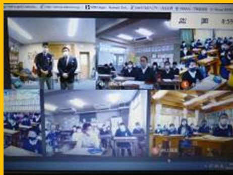
中学校の生徒会が中心となり作成した オンラインオープンスクール