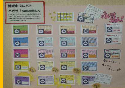
「めざせ！掃除永世名人」の取組