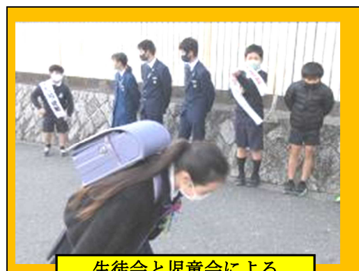
生徒会と児童会による 朝のあいさつ運動