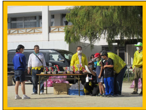
クリーンアップ大会の表彰式