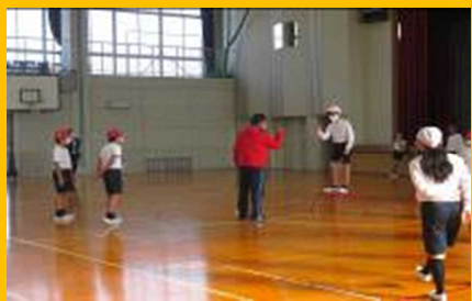
中学校から小学校への 乗入授業