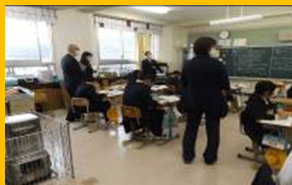
生活づくり部会による 各校での授業参観