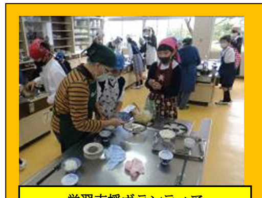
学習支援ボランティア