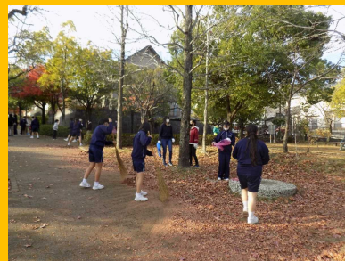
四季が丘クリーン（SC）活動