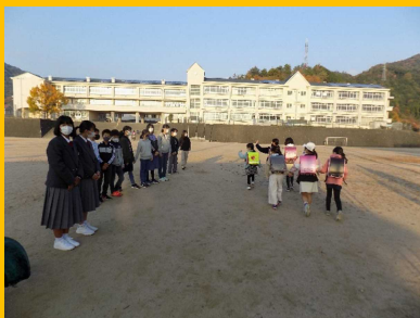
小中合同のあいさつ運動