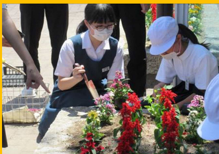
『小中合同花植えの様子』