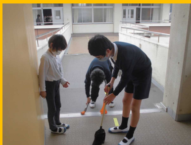
高学年がお手本に「リーダー掃除」の取組