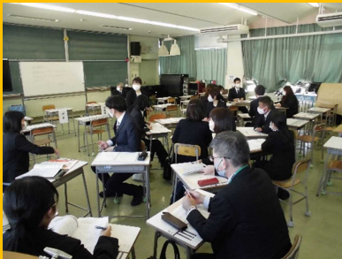
小中合同公開研究会