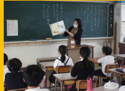
マスク着用、密を避けて「読み聞かせ」の取組