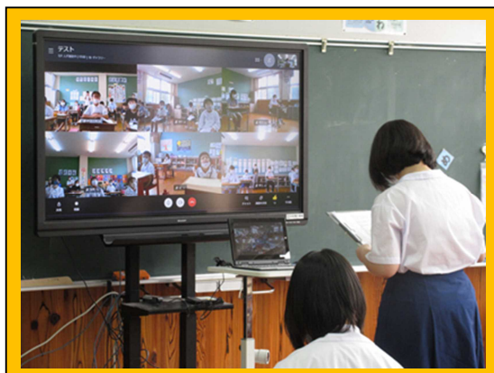
児童生徒総会（オンライン）