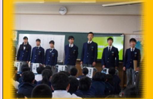
オープンスクール