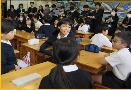
『小中合同研究授業』