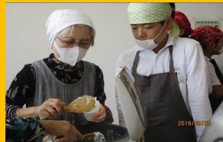
『学園祭体験活動の支援』