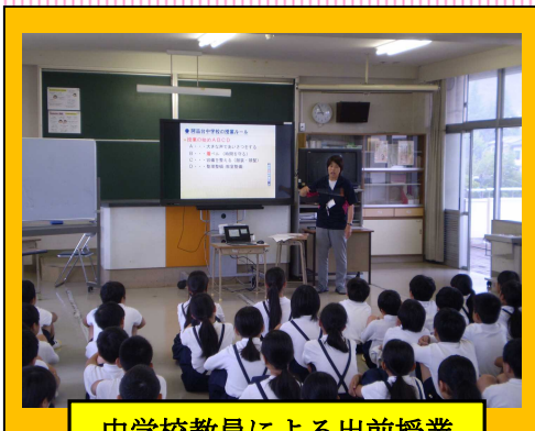
中学校教員による出前授業