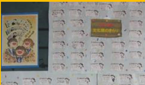
文化祭のきらり（野坂中学校）