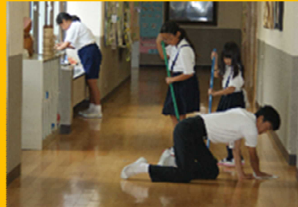
1～9年生での縦割り班清掃