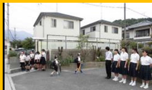
小中合同挨拶運動（宮内小学校）