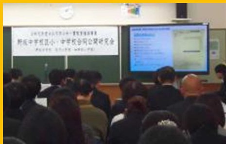
小中合同研究会（地御前小学校）