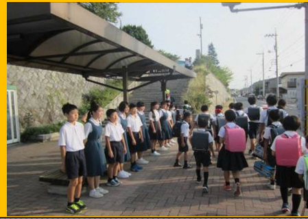
『小中合同挨拶運動』