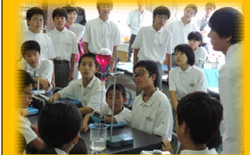
七尾中学校区合同研究会