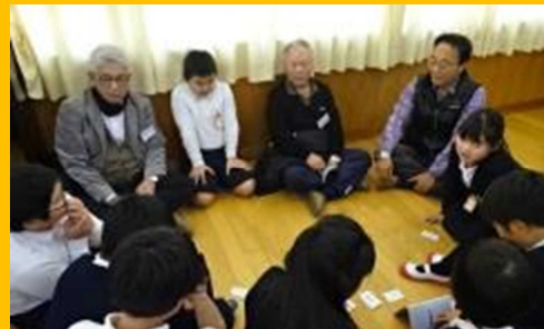
地域の皆様へのありがとうの会（地御前小学校）