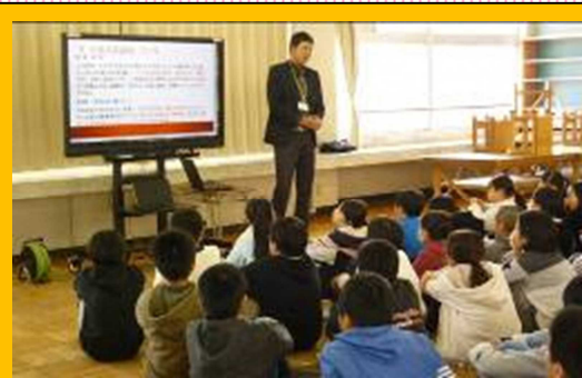
中学校教員による出前授業