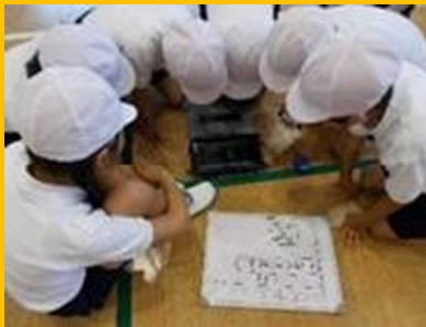
深い学びのためのかかわり合い