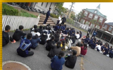
四季が丘クリーン（SC）活動