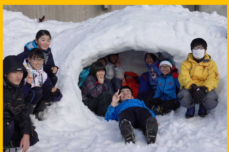
8年新潟まつのやま学園との交流