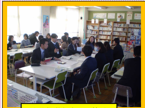
生徒指導部会での協議