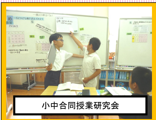
小中合同授業研究会