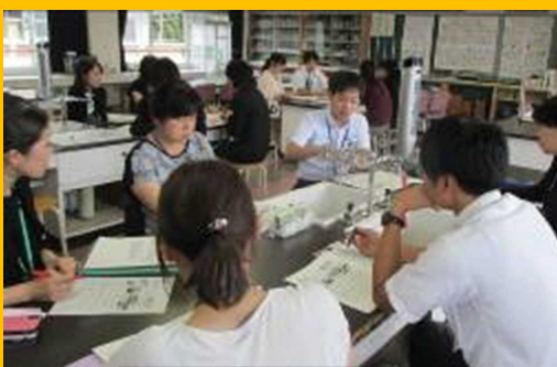
小中合同研究会（分科会）