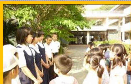
小中合同あいさつ運動