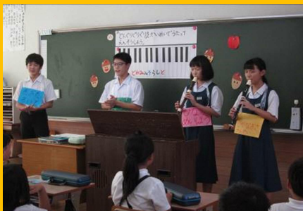
『リトルティーチャーの授業風景』