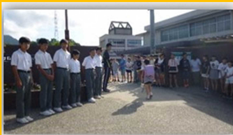
中学生有志による小学校での あいさつ運動