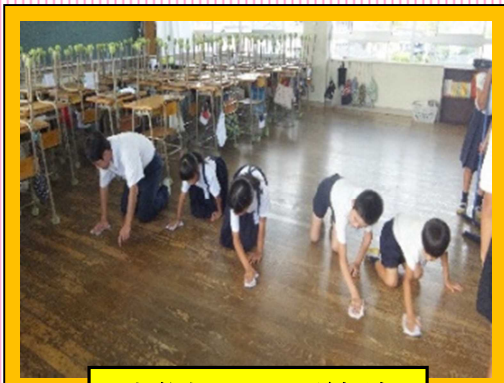
中学生による出前掃除